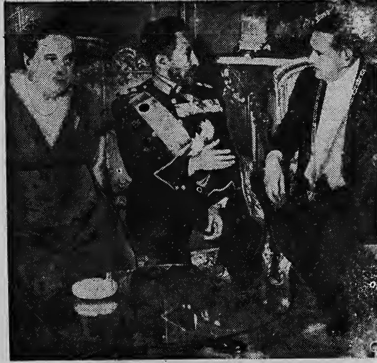
MME. COTY seems to be getting an earful of an interesting story while listening to a conversation between her husband, French President Rene Coty (right), and Emperor Haile Selassie of Ethiopia. They are pictured at a Presidential palace reception in Paris, given by the French Chief of State for the African monarch.